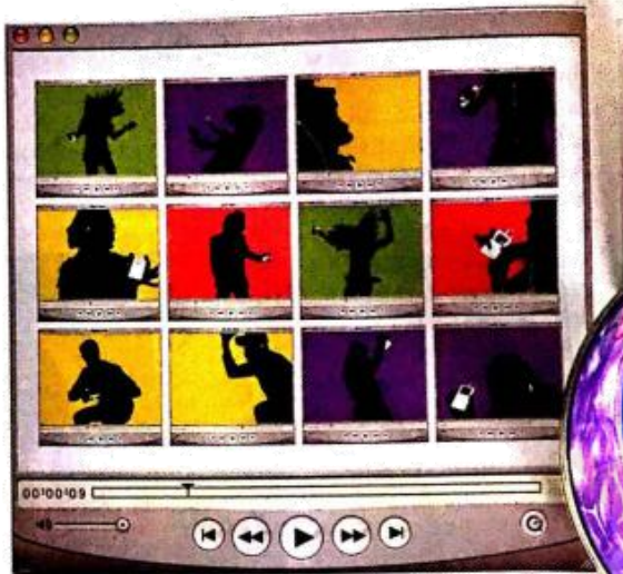
图 47 苹果 iPod 宣传广告 主题:听色彩在跳舞 亮丽的色彩,黑色剪影的人物造型把音乐的感觉发挥得淋漓尽致,该系列广告风格简洁,对比强烈,具有强烈的视觉冲击力。

(3) 锁定范围:在充分联想的基础上进行创意、构思,用排除法缩小要表现的范围,锁定方向,然